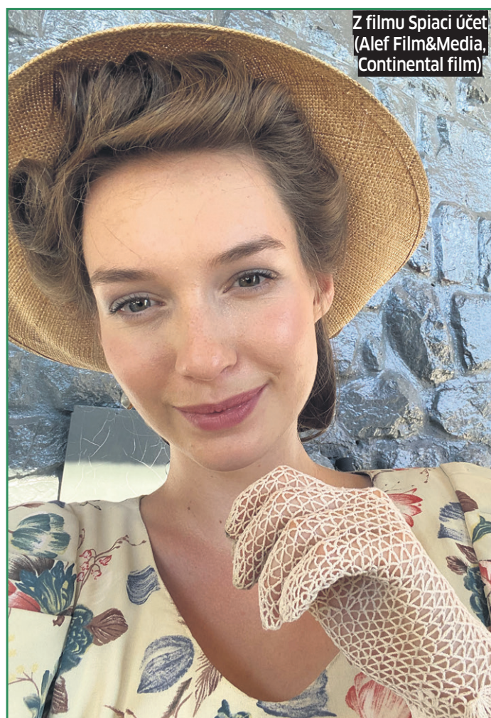
Z filmu Spiaci účet (Alef Film&Media, Continental film)

Vo filme Spiaci účet si svojim prejavom priblížila dnešnému divákovi život mla-