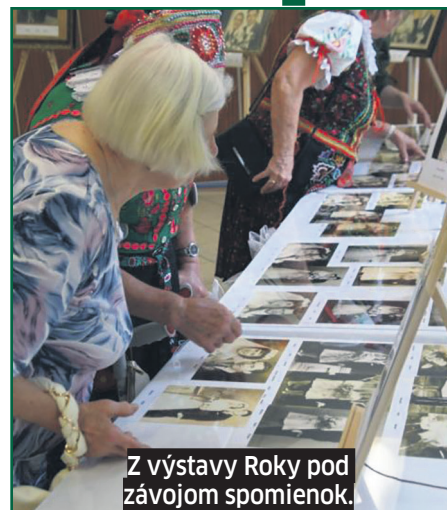
Z výstavy Roky pod závojom spomienok.

Každý návštevník odchádzal domov s výslužkou – v taštičke si niesol suveníry s obecnou tematikou a so vzácnou publi-