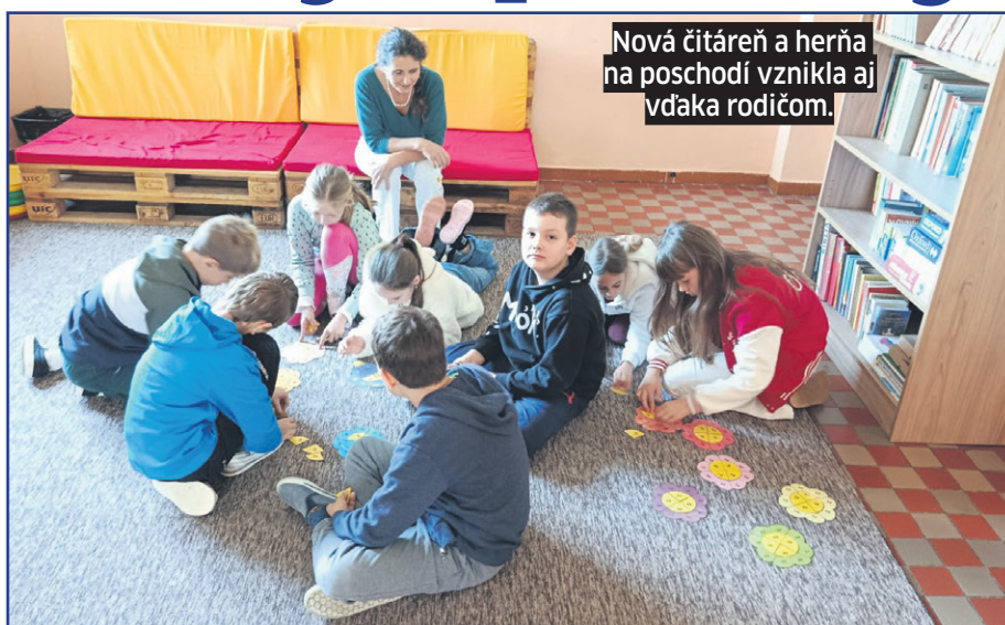
Nová čítareň a herňa na poschodí vznikla aj vďaka rodičom.

Kamarátstvo je fajn, no niekedy môže byť nebezpečné. Koncom októbra sa