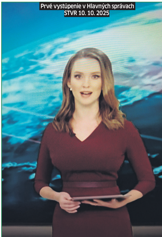
Prvé vystúpenie v Hlavných správach STVR 10. 10. 2025

viac ma to potom zasiahlo, keď som si dieľo pozrela. Bolo to ťažké obdobie. Príbeh z minulosti nám ukázal, akí sme aj dnes.