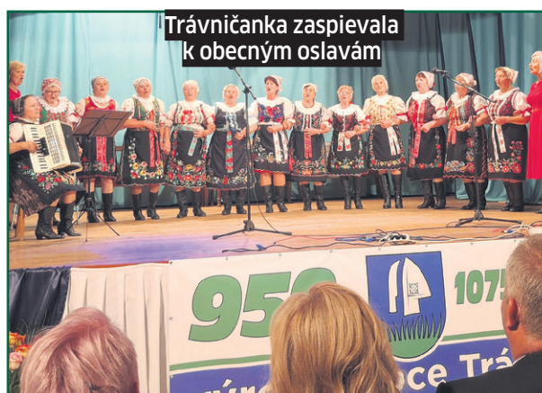
Trávníčanka zaspievala k obecným oslavám