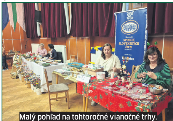
Malý pohľad na tohtoročné vianočné trhy.

nali sa totiž hneď na druhý deň po Mikulášovi. Namiesto sedadiel plné stoly, ale ihličie z čečiny voňalo rovnako intenzívne. Domáci aj cezpoľní predajcovia ponúkali svoje produkty, tovary – med aj oplátky už sprítomňovali štedrosť dňa, kedy sa rozsvietia vianočné stromčeky v každej domácnosti. Nádherný Betlehem, ktorý