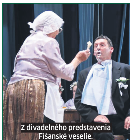
Z divadelného predstavenia Fíšanské veselie.

Vzájomná dôvera a pocit, že obec je spoločným domovom, sa budujú postupne. Na oslavách 950. výročia Trávnice sme tú „budovateľskú cestu“ mohli vidieť a počuť. Lebo program a atmosféru dvoch dní (13. a 14. septembra) vytvorili Trávníčania. Mladí aj starší. Vložili doň svoju šikovnosť, svoj um, svoje nadanie. O tom, ako budú oslavy vyzerieť, sa diskutovalo po celý rok. V hre bolo aj pozvanie umelcov, aby dali obecným narodeninám zlatý cveng. Zlaté však bolo rozhodnutie samosprávy - dôverovať našincom.