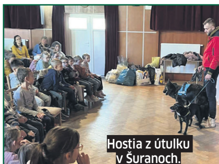
Hostia z útulku v Šuranoch.

žiaci naučili, že nie každý internetový kamarát je úprimný a že treba rozlišovať a brániť sa pred rizikami sociálnych sietí. Pomohla im prednáška, ktorá zlepšila aj ich digitálnu gramotnosť a povedomie o zodpovednosti voči svojmu okoliu.