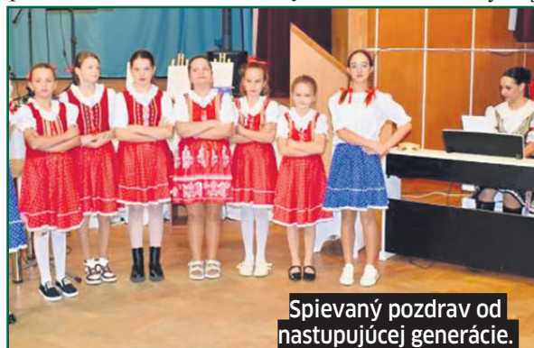
Spievajú pozdrav od nastupujúcej generácie.

Do života trávnických šesťdesiatnikov, sedemdesiatnikov a osemdesiatnikov prišlo v októbri, Mesiaci úcty k starším,