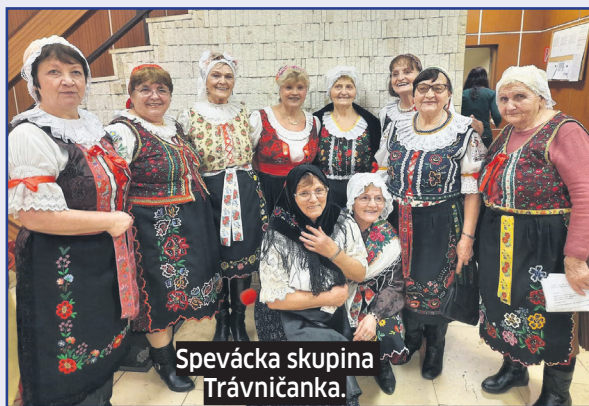
Spevácka skupina Trávnica.