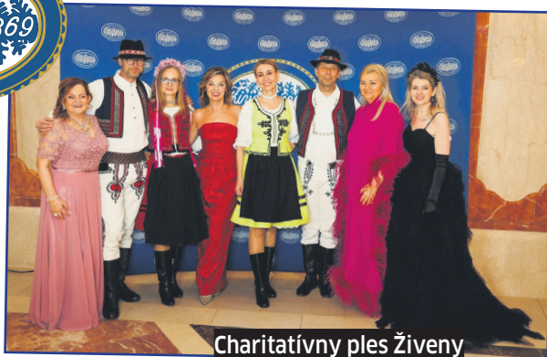
Charitatívny ples Živeny

Príjemnú predsviatočnú atmosféru dotváral štrnásteho decembra aj krásny drevený Betlehem, milý hudobný koncert a tiež vôňa punču, ktorý pripravili dámy z miestneho spolku Červeného kríža.