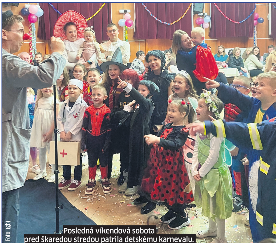
Posledná víkendová sobota pred škaredou stredou patrila detskému karnevalu.