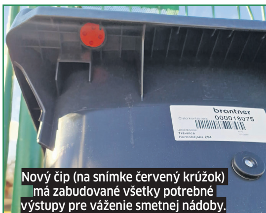
Nový čip (na snímke červený krúžok) má zabudované všetky potrebné výstupy pre váženie smetnej nádoby.

„Ten najpodstatnejší je v tom, že sa znížia celkové náklady obce. Je to zásluhový systém. Každý si rozmyslí, či do kontajnera hodí všetko nepotrebné, aj to, čo by mal vyseparovať a čo zvyšuje hmotnosť nádoby. Menej zmesového odpadu znamená menej peňazí, ktoré obec platí zbe-